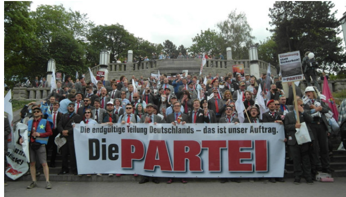
Bundesparteitag in Erfurt, 21. Mai 2016

Diskutieren Sie mit uns. Unterstützen Sie uns. Werden Sie Mitglied. Werden Sie PARTEI-Spender(in). Kommen Sie zu unseren Stammtischen. Folgen Sie uns auf Facebook, Twitter oder wo immer Sie uns finden. Unterstützen Sie die echte Alternative für Wolfsburg. Schlimmer wird es auch ohne uns.