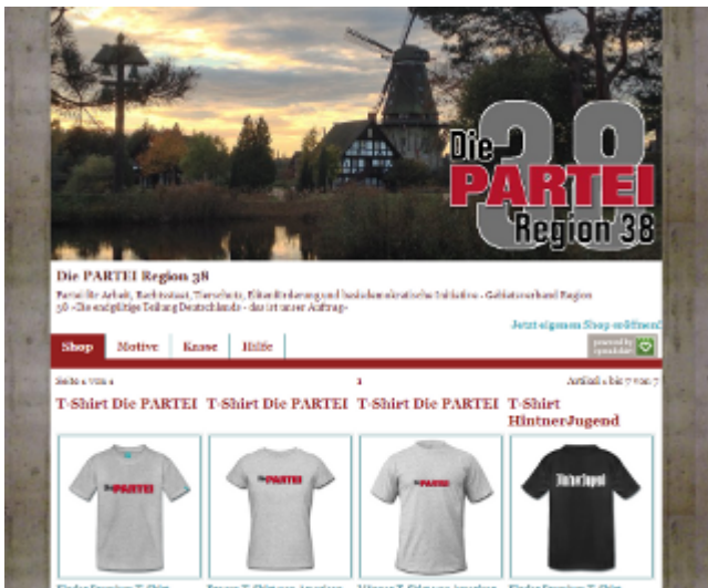
Shop der PARTEI Region 38 [2]

Es muss nicht immer der graue Polyesteranzug von C&A für €59,- sein. Wenn Sie gut gekleidet sein wollen, können Sie sich auch in unserem Webshop [2] mit T-Shirts u.ä. eindecken. Damit können Sie hoch erhobenen Hauptes durch die Stadt gehen, ohne dumm angeguckt zu werden. Versuchen Sie das einmal mit einem T-Shirt der FDP. Stöbern Sie auch ruhig in den Shops der Parteifreunde aus Berlin [3], Dortmund [4] und Frankfurt [5].